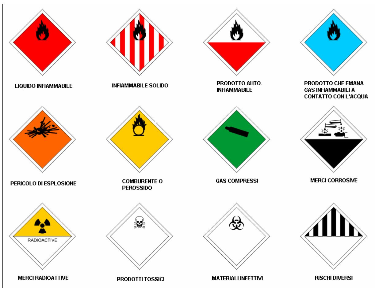
Targa romboidale presente sui mezzi adibiti al trasporto di sostanze pericolose

Poiché è impossibile prevedere quando possa verificarsi un incidente con rilascio di sostanze pericolose nell'ambiente, tale tipo di rischio rientra nella classe dei rischi imprevedibili.